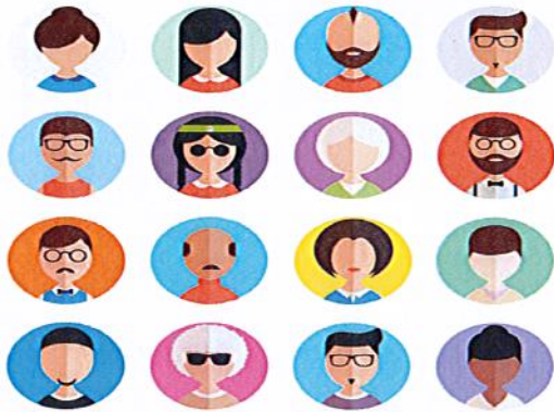
designed by freepik.com