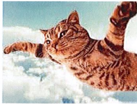
Le chat volant