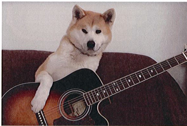
Le chien qui fait de la guitare