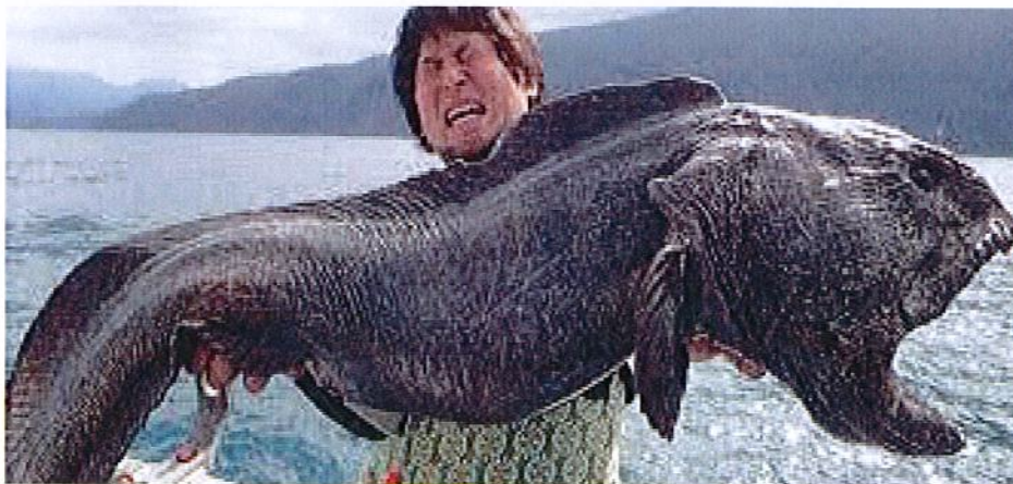
Le poisson de la préhistoire